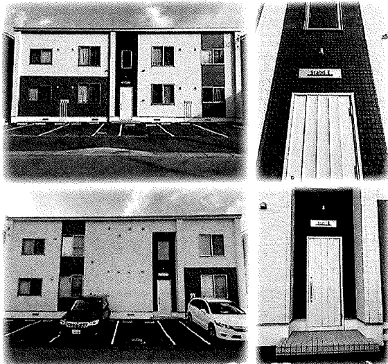
オーナーチェンジ物件 【2棟一括売却】

周辺施設：三井アウトレットパーク札幌北広島、スーパー、公園等充実した生活環境 新千歳空港へも北広島駅からJR快速エアポートで乗り換えなしの22分のアクセス!札幌駅までも乗り換えなしの18分!